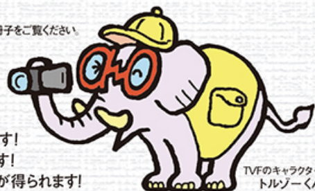
TVFのキャラクター トルゾーくん

TVFはサポーターの会費と寄付によって運営され、開催されます。 私達のNPO活動をどうかご支援ください!