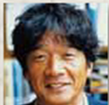
椎名 誠 作家