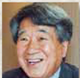
羽仁 進 映画監督