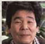
高畑 勲 アニメーション映画監督