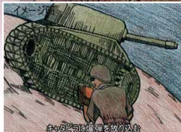
映像作品「アジア太平洋戦争、中国の二つの戦争」より(2枚とも)